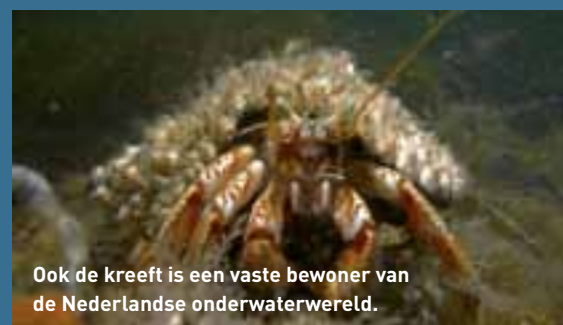
Ook de kreeft is een vaste bewoner van de Nederlandse onderwaterwereld.